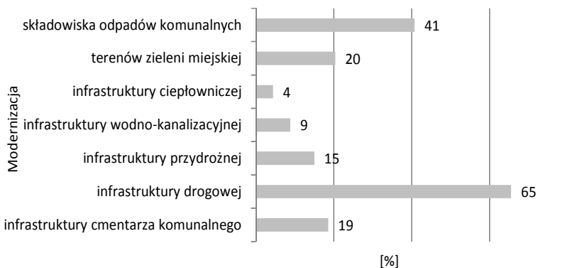
Rys. 2. Elementy infrastruktury technicznej, które według respondentów powinny zostać poddane modernizacji w Grajewie w najbliższym czasie [%]

Zdecydowana większość przebadanych mieszkańców gminy miejskiej Grajewo oczekuje w pierwszej kolejności poprawy infrastruktury drogowej, składowiska odpadów komunalnych wraz z infrastrukturą do ich utylizacji oraz zieleni miejskiej (rys. 2). Tylko co dziesiąty respondent uważał, że modernizacji nie muszą w najbliższym czasie zostać poddane drogi na terenie gminy, a co trzeci, że modernizacji nie wymaga składowisko odpadów komunalnych. W tym przypadku potrzeby badanych dotyczą modernizacji składowiska odpadów pokrywają się ze związaną z tym inwestycją - „Biebrzańskim Systemem Gospodarki Odpadami” - dofinansowywaną przez Unię Europejską i mającą na celu poprawę oraz rozwój infrastruktury technicznej w kwestii unieszkodliwiania odpadów. Badani mieszkańcy uważają, że priorytetowo powinny zostać powzięte inwestycje mające na celu działania związane z remontami dróg i ulic na obszarze Grajewa, jak również szybkie wprowadzenie technologii unieszkodliwiania odpadów (w tym uruchomienie sortowni odpadów oraz kompostowni odpadów biodegradowalnych). W tym przypadku te inwestycje przeprowadzone w pierwszej kolejności niewątpliwie poprawią standard życia mieszkańców i warunki inwestowania dla przedsiębiorców.